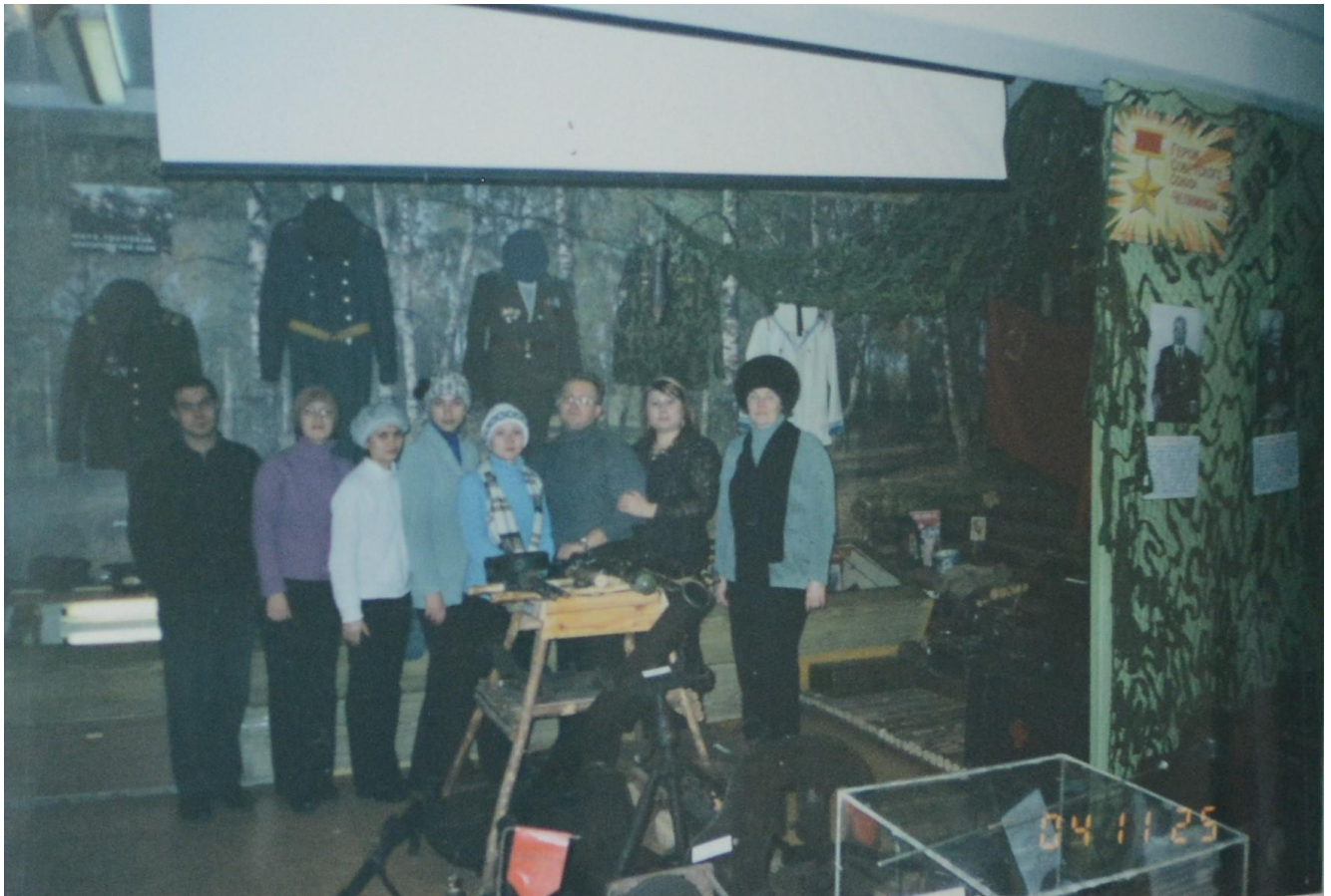
Молодежь ОАО «ПАК» на экскурсии в музее «На пути к Победе».