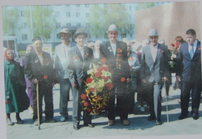
Ветераны Великой Отечественной Войны и труженики тыла 9.05.2010года