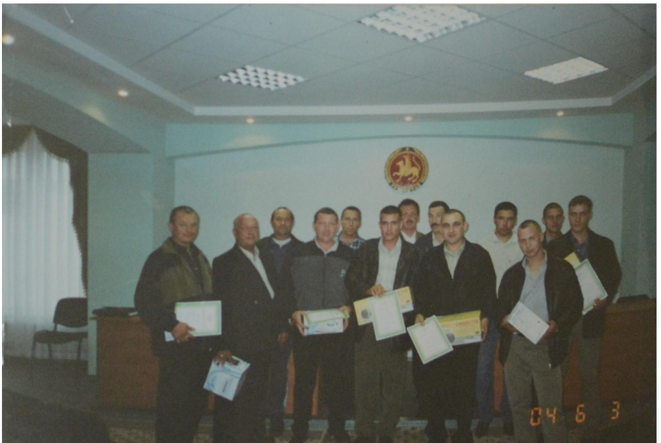
Водители ОАО «ПАК» участники республиканского конкурса профессионального мастерства водителей автобусов.