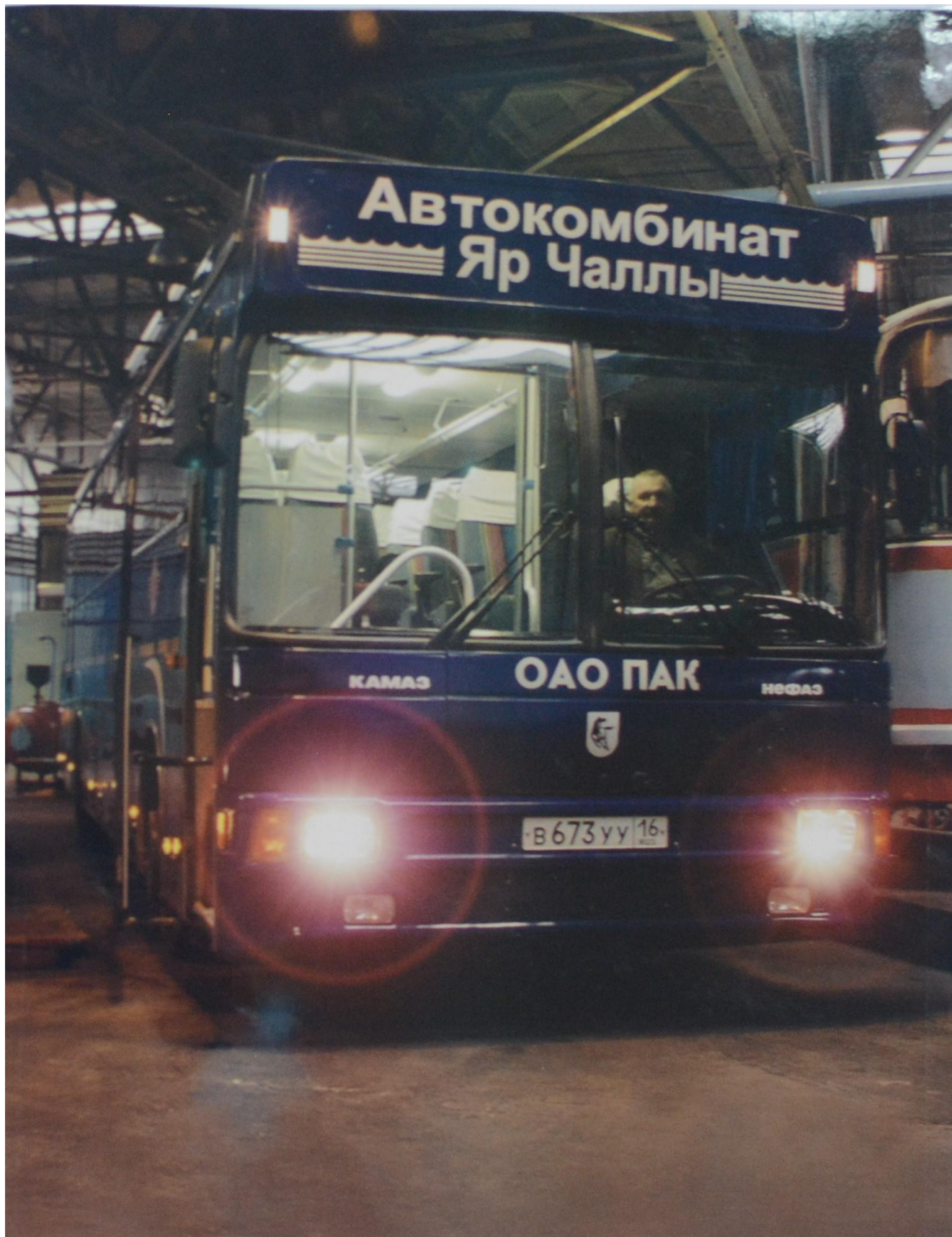
Водитель автоколонны №1 - Сабитов М.Х.