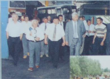
Посещение моторного участка