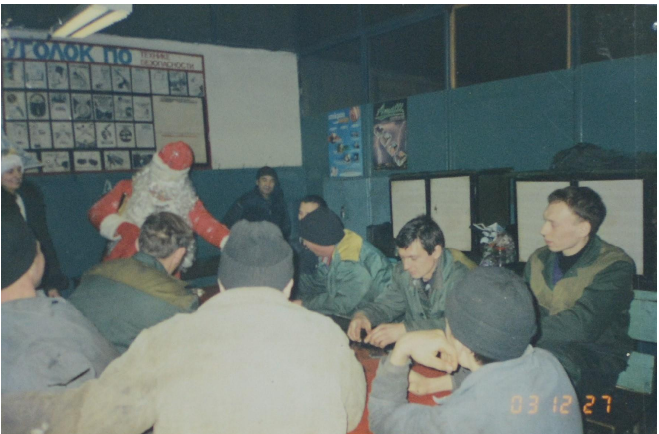
Новогоднее поздравление ремонтным рабочим.