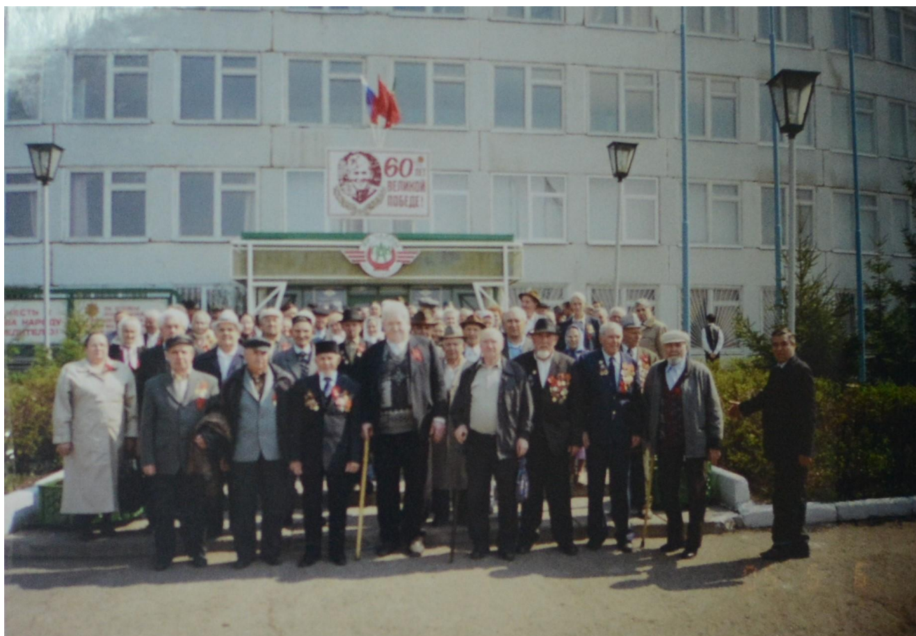
9 Мая 2005 г. Ветераны ОАО «ПАК»