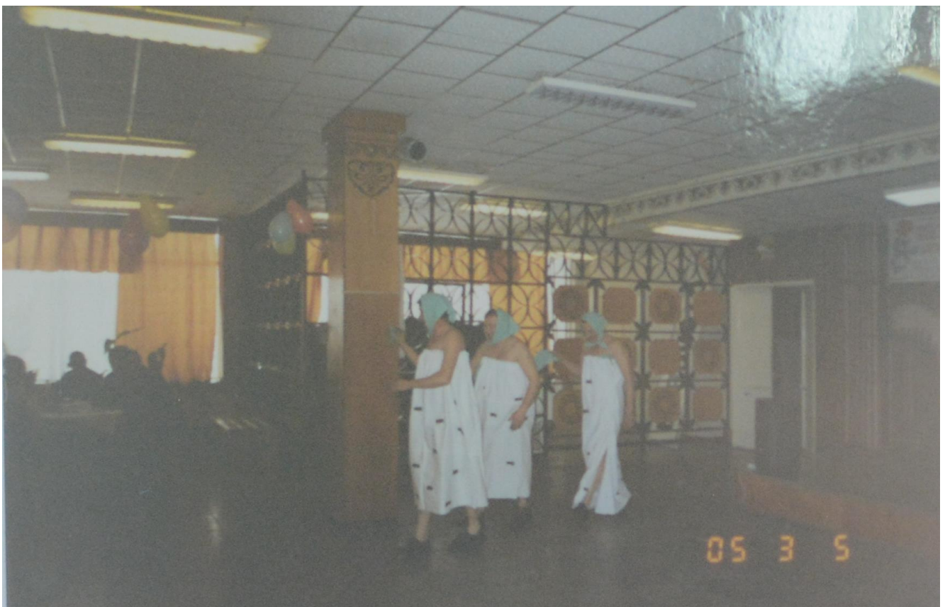
Танец «Берёзка» в исполнении автослесарей .