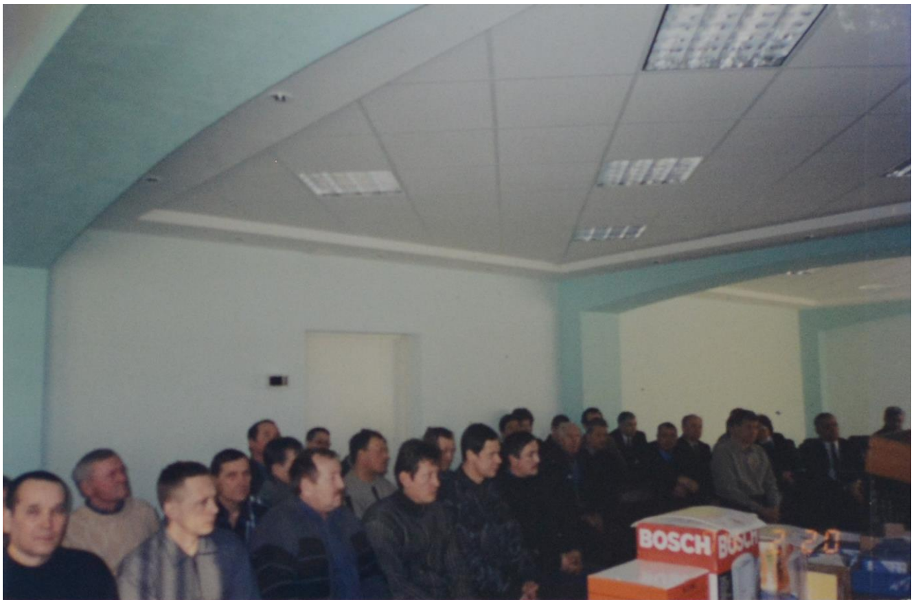
День Защитника Отечества .

20.02.2004 г. Воины – интернационалисты с руководством предприятия.