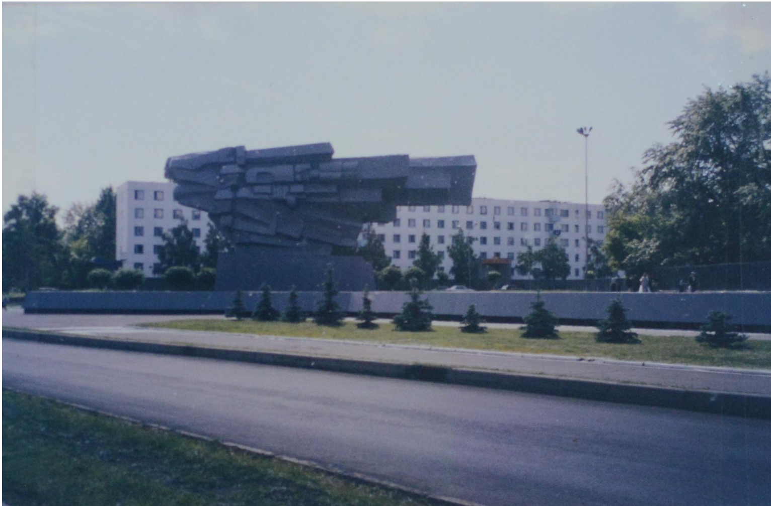
Пр. М. Джалиля. Памятник «Родина-Мать» открыт к 30 летию Победы в Великой Отечественной войне.