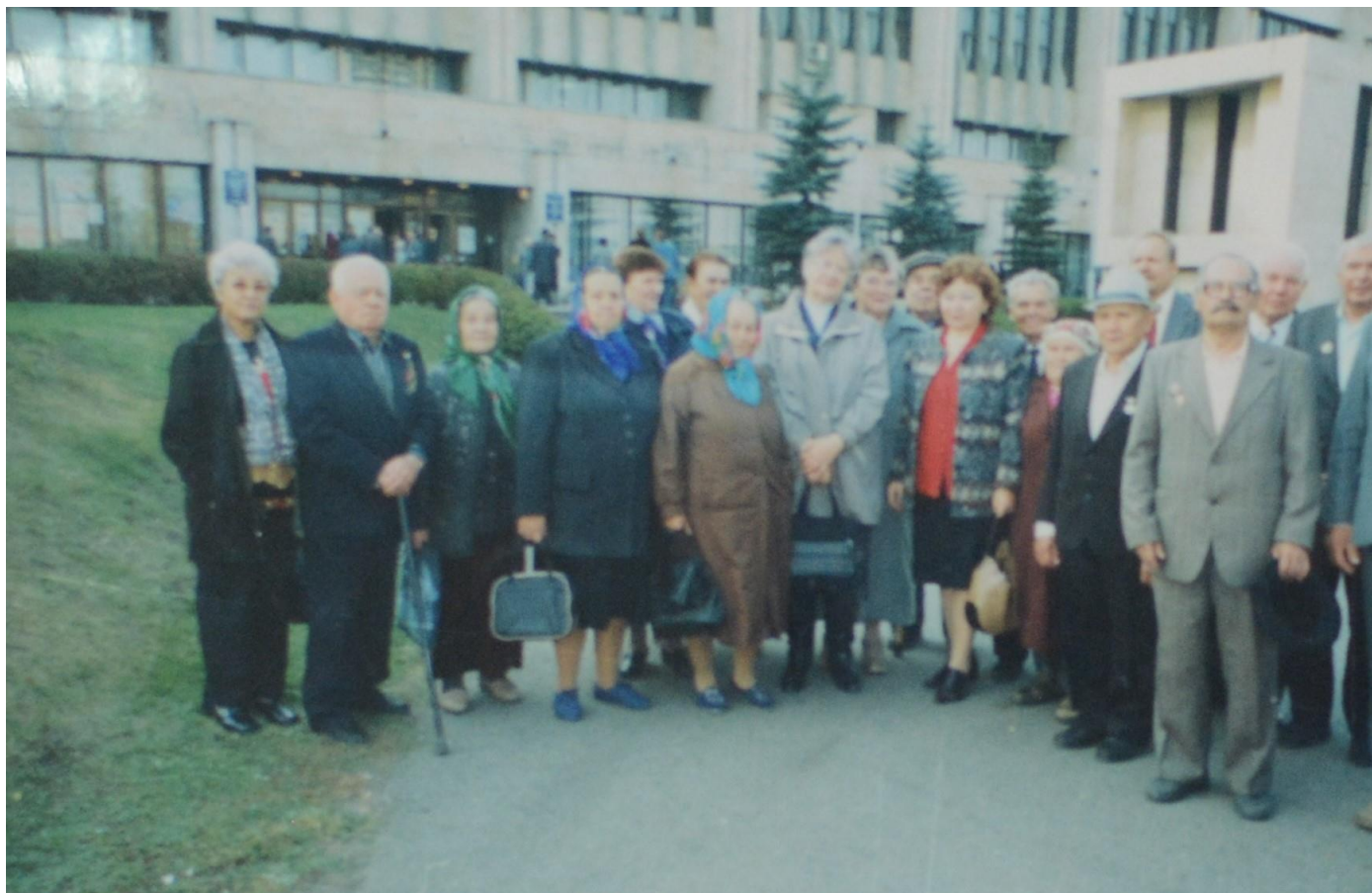
2005 г. День Пожилых людей.