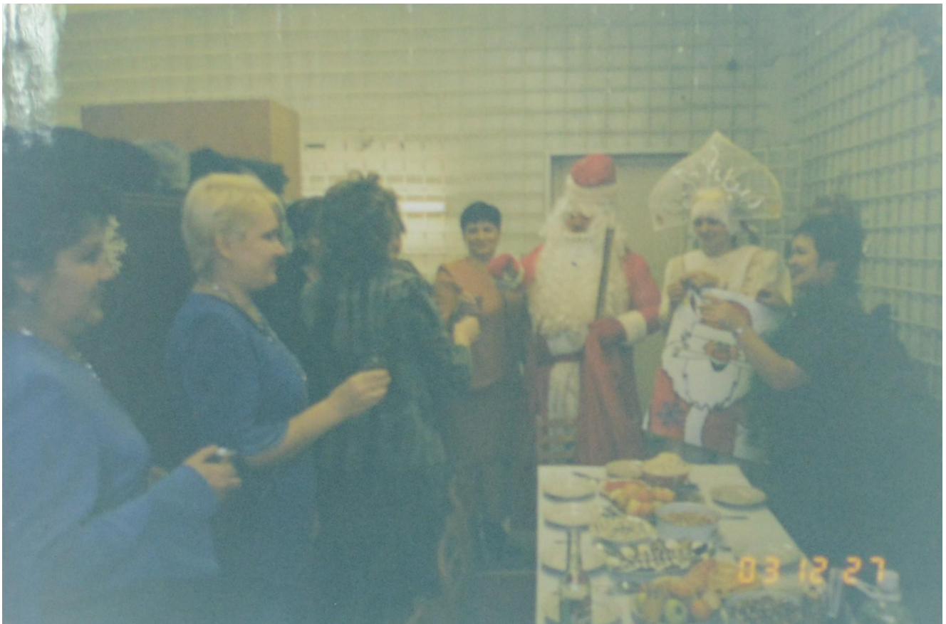
Дед Мороз и Снегурочка В гостях у работников билетной кассы.