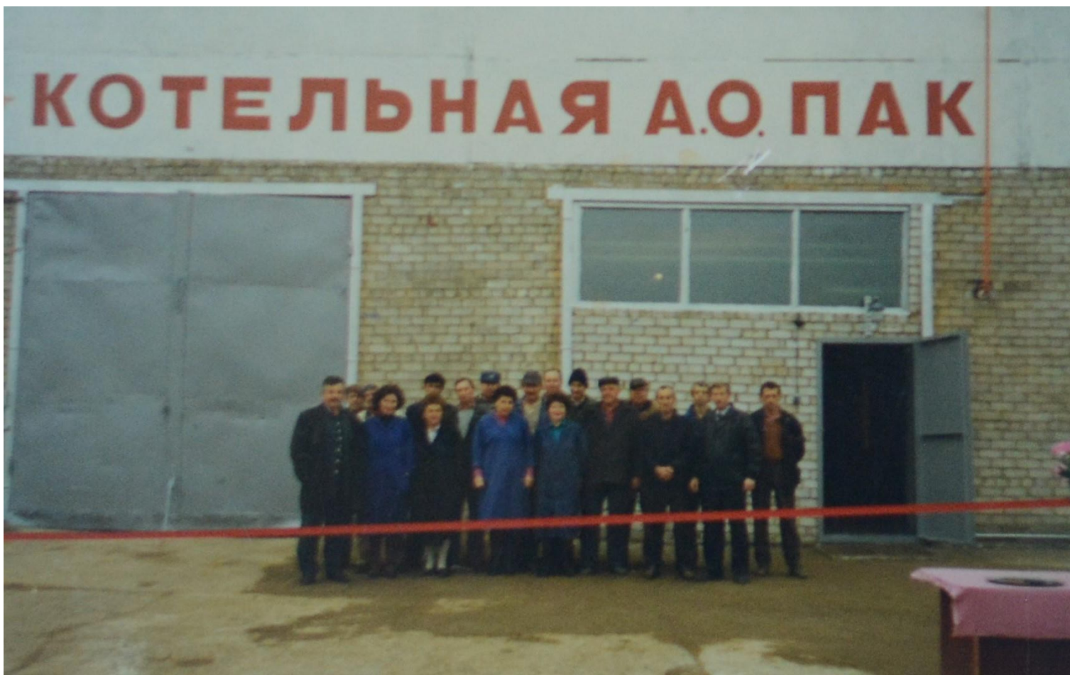
2000 г. Коллектив котельной.