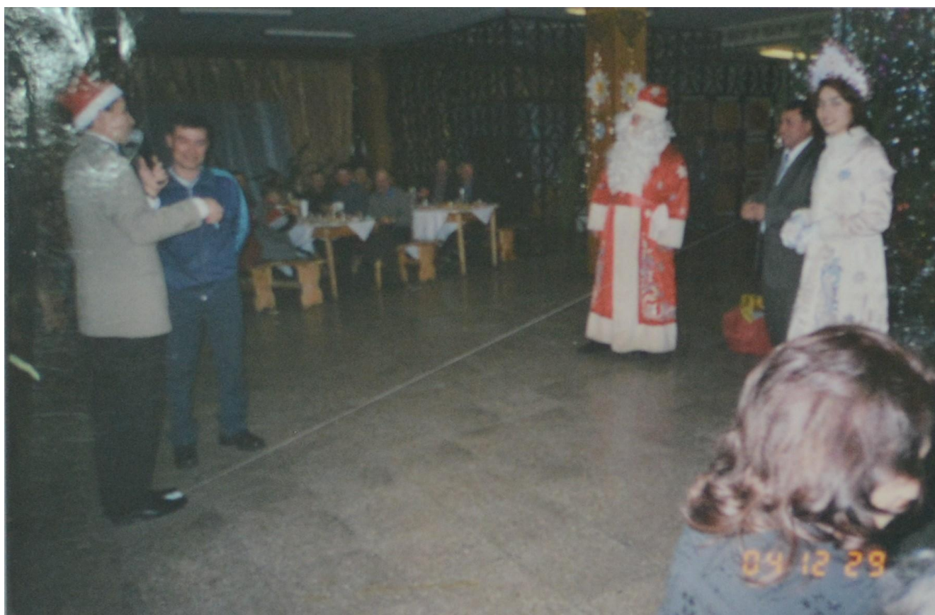
На новогоднем «Огоньке».