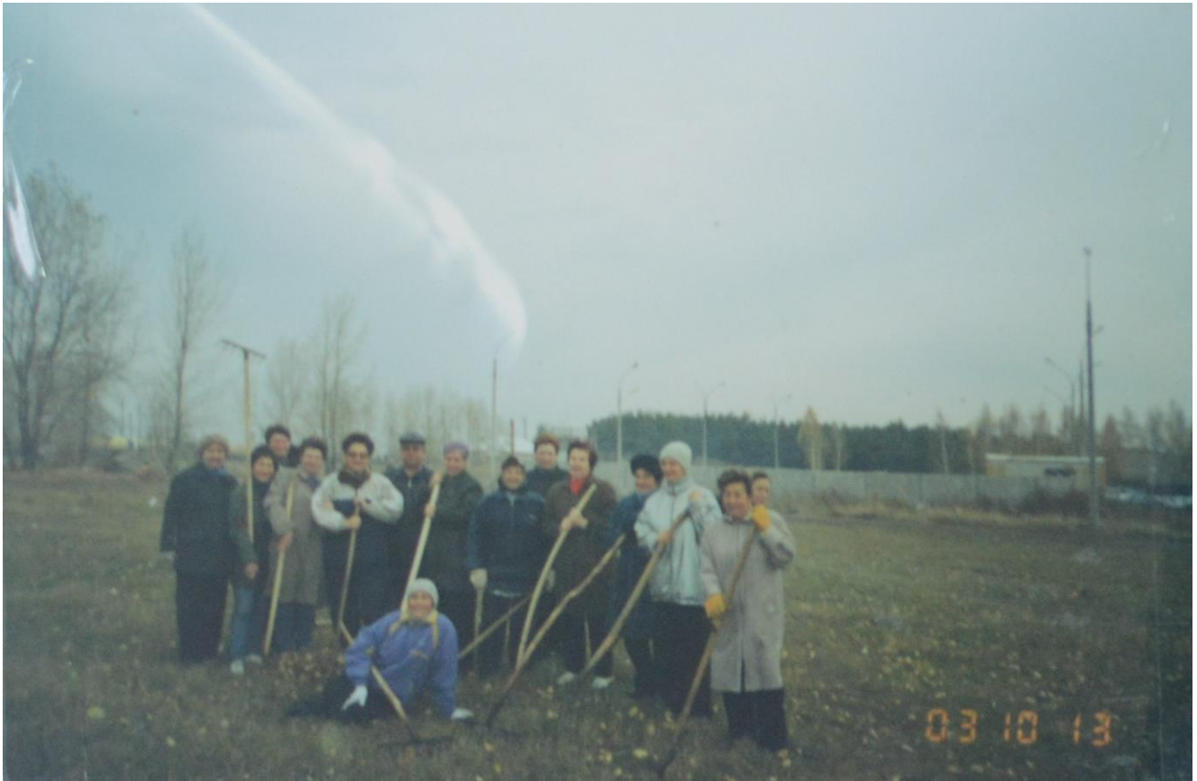
Работники автовокзала на субботнике.