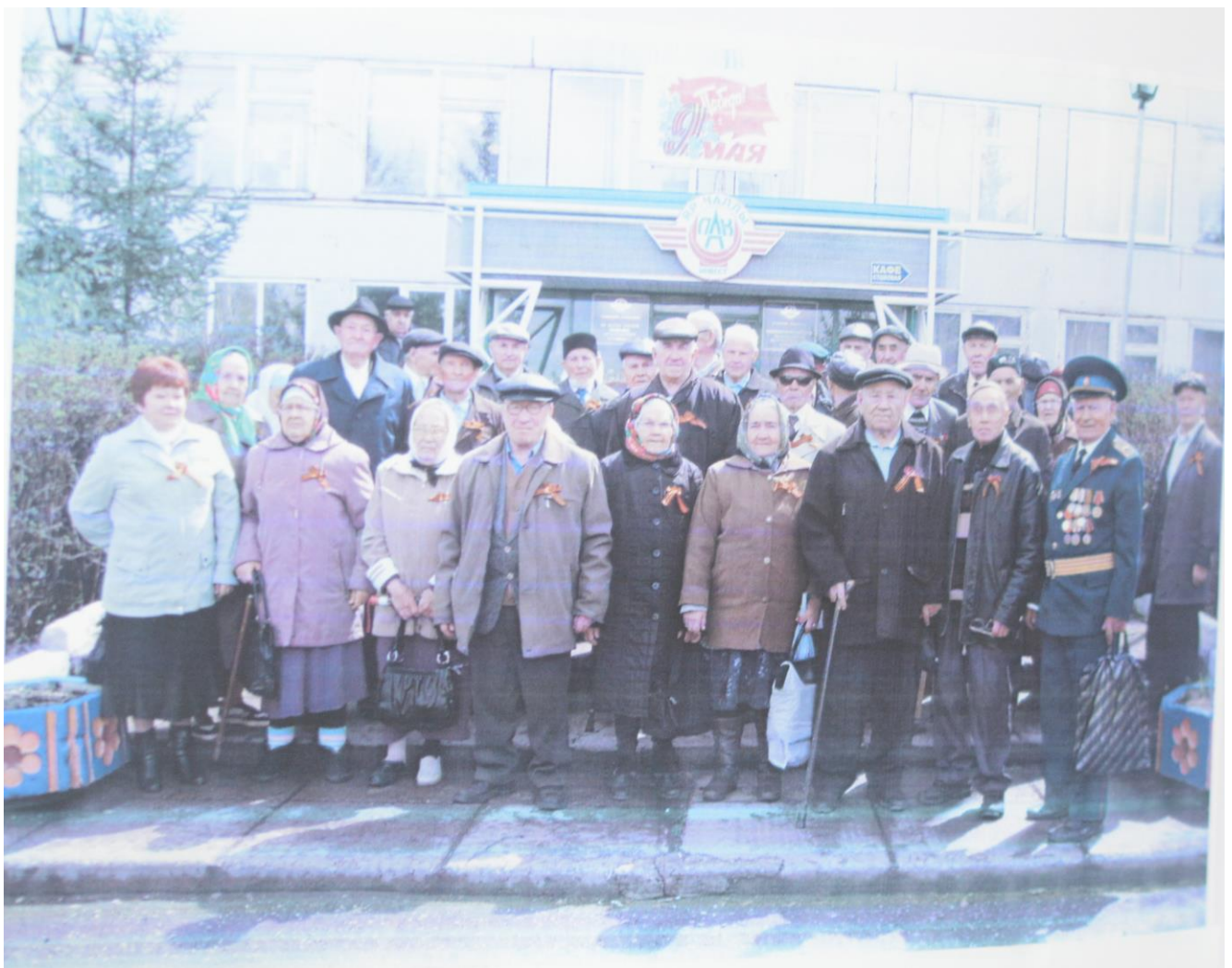
Ветераны ВОВ и труженики тыла 7.05.2013 г .