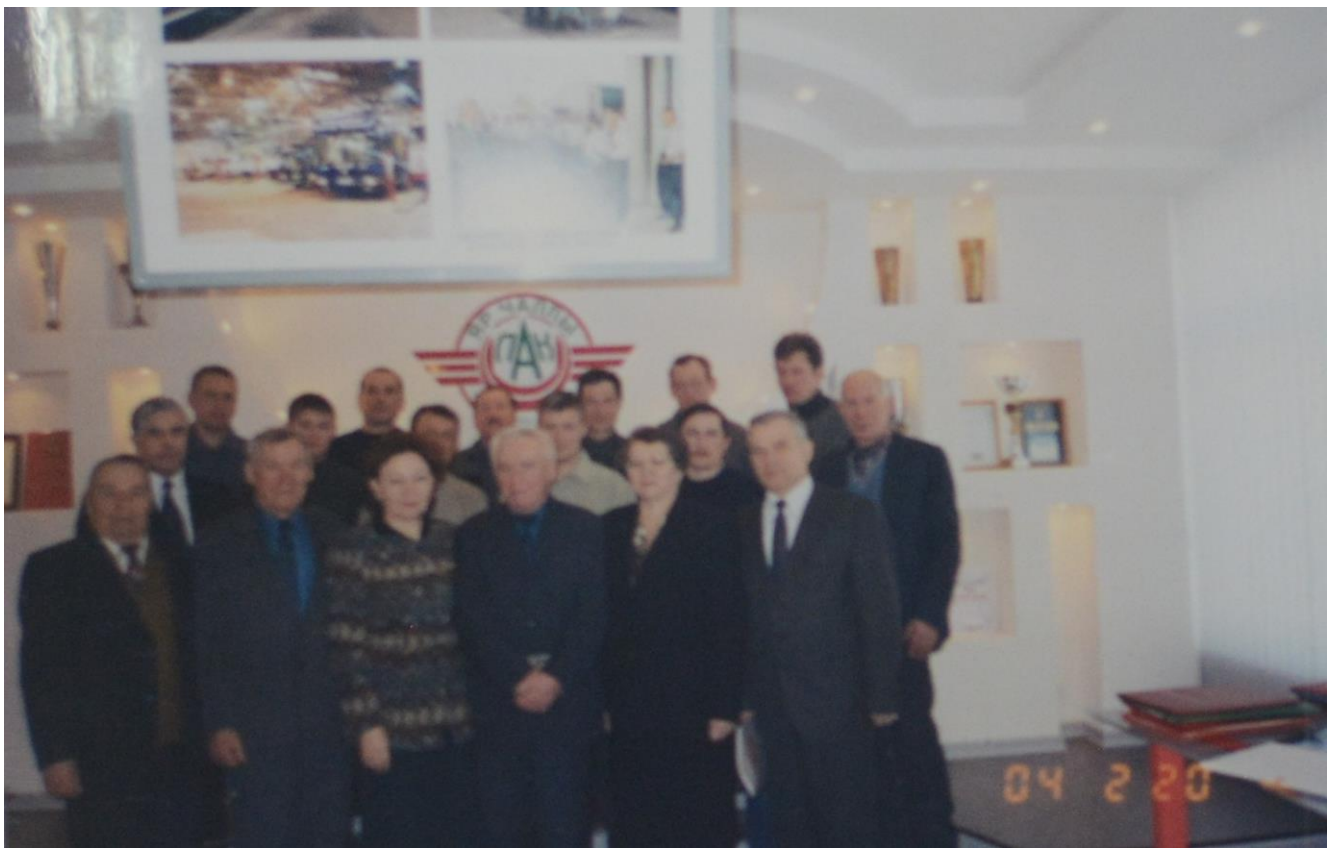
Музей ОАО «ПАК». День защитника Отечества.

20.02.2004 г. Воины – интернационалисты с руководством предприятия.