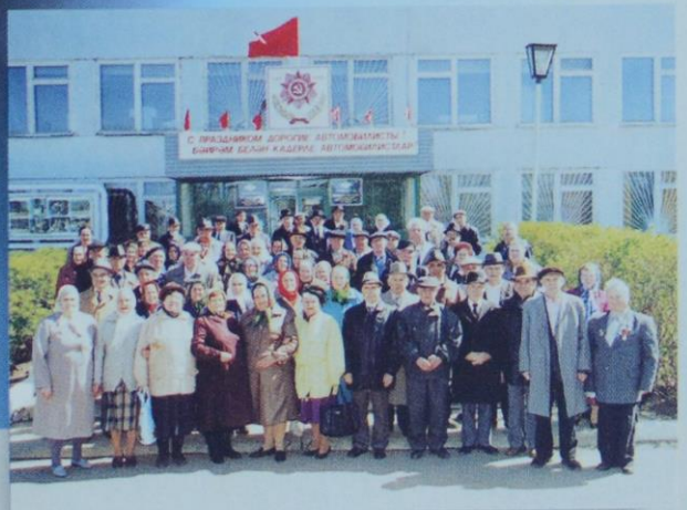
Ветераны труда и участники ВОВ

В ОАО «ПАК» с 1992 года проводится ежегодный праздник — День предприятия-сабантуй. Для работников автокомбината он стал традиционно семейным. Организовываются спортивные состязания, национальная борьба, всевозможные игры для детей. Завершается праздник вручением главного приза победителю национальной борьбы барана и ценного подарка.