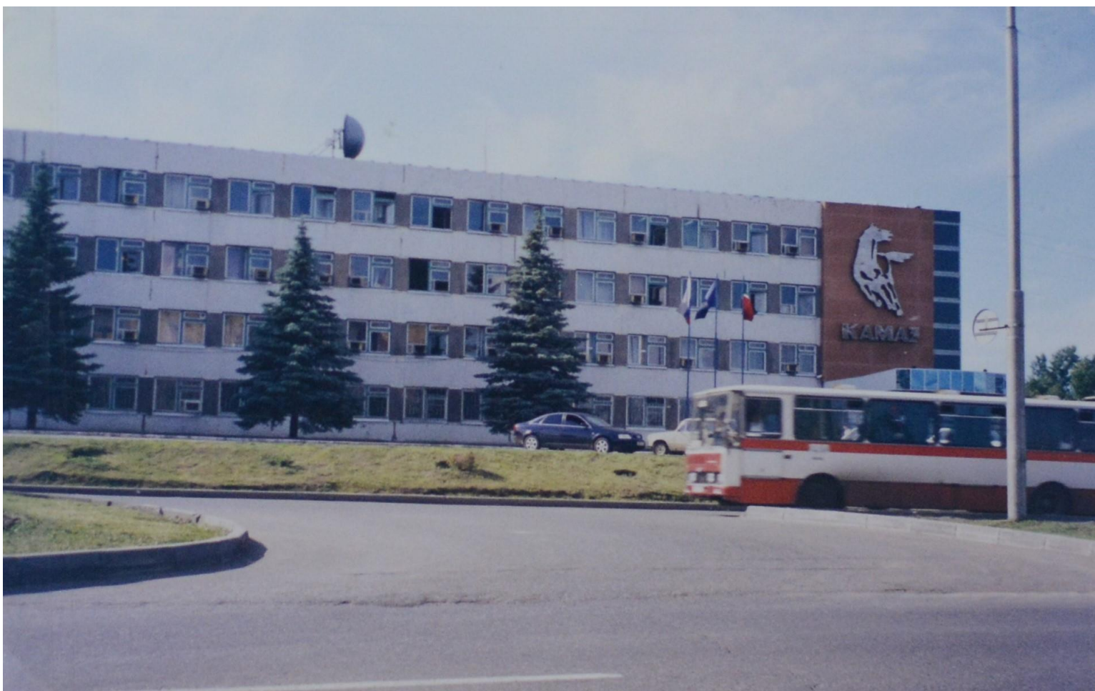
Пр. М. Джалиля. Дирекция «Камаза».