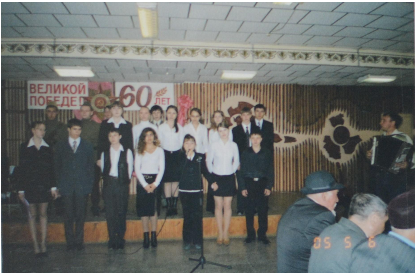
Перед ветеранами ВОВ выступают учащиеся 45 школы .