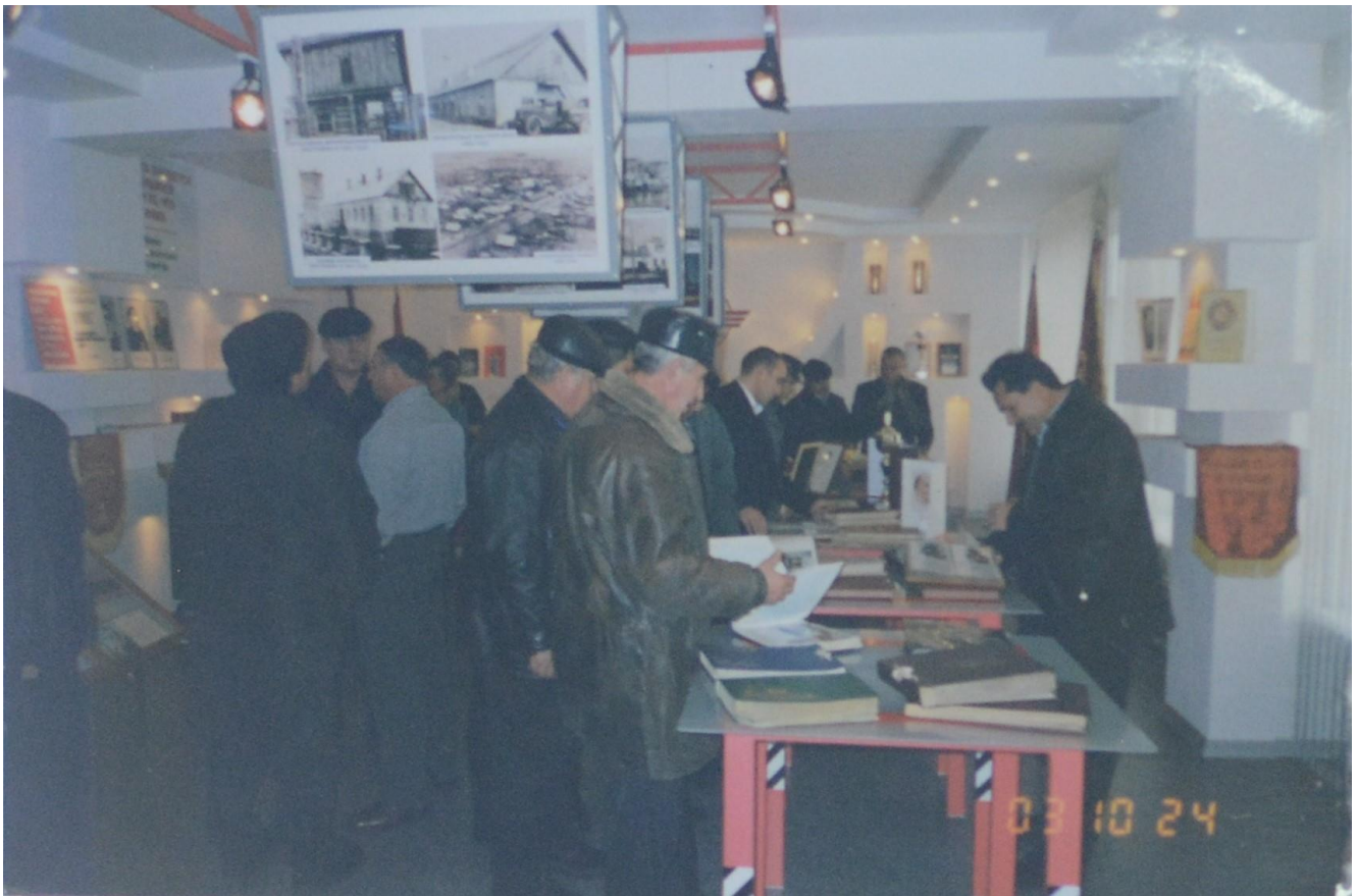
24.10.2003 г. Музей ПАК – открыл свои двери первым посетителям – работникам предприятия.