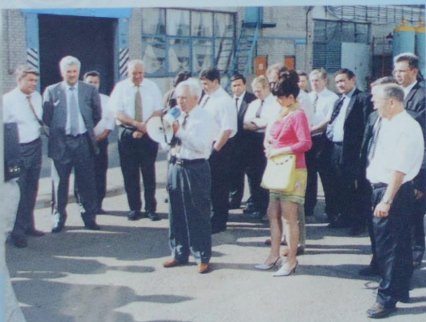
Участники совещания: главы администраций Закамского региона и руководители Департамента транспорта при Кабинете министров РТ

Участниками совещания был отмечен передовой опыт эксплуатации и ремонта автомобильного транспорта в ОАО «ПАК», создание условий для удовлетворения потребностей в транспортных услугах населения и организаций.